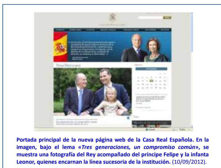
Ilustración 10: Página web de la Casa Real

El 10 de septiembre de 2012 , la Casa Real Española lanza una nueva página web 24 donde, entre otras cosas, se puede ver una fotografía que recoge la línea sucesoria de la Corona. La Infanta D a . Leonor de Borbón y Ortiz, nacida en 2005, es la heredera al trono debido a que su única hermana, menor que ella, también es niña 25 . El problema podría haber surgido si el segundo hijo de los Príncipes de Asturias hubiera sido un niño. Todavía está pendiente de hacerse las reformas necesarias para equiparar ambos sexos en la sucesión al Trono 26 .