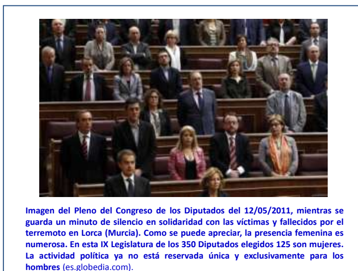
Ilustración 8: Diputadas de la IX Legislatura

El 12 de mayo de 2011 , Miguel Lorente Acosta presenta un estudio que analiza la concentración de homicidios por violencia de género entre los años 2003 y 2010. El análisis de los 545 homicidios cometidos durante este período ha sido realizado y presentado por el catedrático de Estadística de la Universidad de Granada, Juan de Dios Luna del Castillo. Las conclusiones del estudio establecen que los homicidios por violencia de género tienden a concentrarse temporalmente en un patrón estable y que el riesgo de que se cometa un asesinato al día siguiente de un caso previo se incrementa en un 67 por ciento y a los diez días en un 30 por ciento 218 .