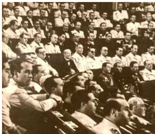
Imagen de las Cortes Españolas en 1943. Como se puede apreciar, no hay presencia femenina. La actividad política continuaba estando reservada única y exclusivamente para los hombres.