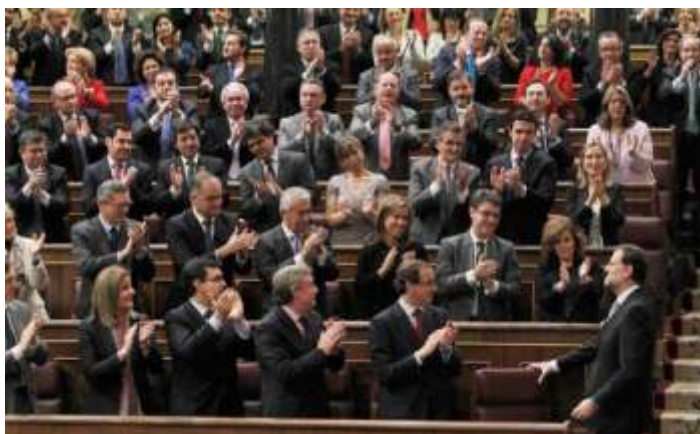
Imagen del Congreso de los Diputados del 20/12/2011, mientras se celebra la segunda y última sesión del debate de investidura de Mariano Rajoy como Presidente del Gobierno de España. Como se puede apreciar, la presencia femenina es numerosa. En esta IX Legislatura de los 350 Diputados elegidos 124 son mujeres. Se consolida el papel de la mujer en la actividad política española. (Noticias.Terra.es).

El 15 de diciembre de 2011 , aparece en todos los medios de comunicación que un hombre condenado a 26 años de cárcel por matar a tiros a su mujer y a un hijo de ambos en Laguna de Duero (Valladolid) en 1998, cobra desde entonces la pensión de viudedad por la fallecida (unos 800 euros mensuales). El Gobierno en funciones lo comunica a la Abogacía del Estado para su estudio. Se dispara la indignación de la opinión pública, produciéndose gran alarma social.