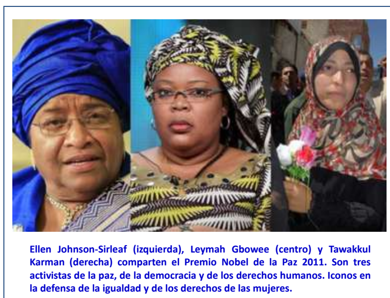
Ilustración 2: Premio Nobel de la Paz 2011

Como un gran paso en defensa de la igualdad, el 7 de octubre de 2011 , el Comité Nobel de Noruega otorga el Premio Nobel de la Paz 2011, en tres partes iguales 11 , a la liberianas Ellen Johnson-Sirleaf 12 y Leymah Gbowee y a la activista yemenita Tawakkul Karman, por la lucha no violenta en favor de los derechos, seguridad e igualdad de las mujeres. Se trata de la primera vez, en sus 110 años de historia, que el premio es concedido a tres mujeres a la vez 13 .