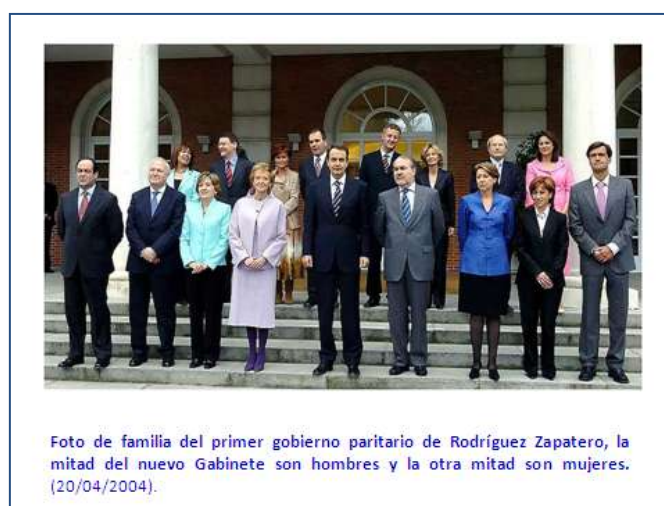
Ilustración 6: Primer gobierno de Rodríguez Zapatero

El Real Decreto 562/2004, de 19 de abril de 2004 , que "aprueba la estructura orgánica básica de los departamentos ministeriales" 2 , crea la Secretaría General de Políticas de Igualdad, como órgano directivo del Ministerio de trabajo y Asuntos Sociales.