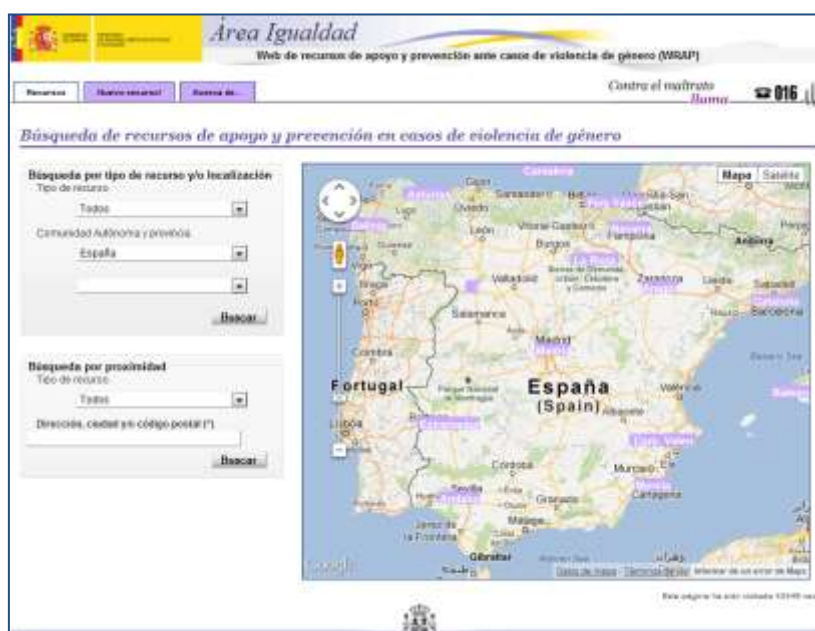
Ilustración 12: Web de recursos de apoyo y prevención VdG (WRAP)

WRAP es la "Web de recursos de apoyo y prevención ante casos de violencia de género" 1 y se constituye como un servicio integrado en la página web del Ministerio de Sanidad, Servicios Sociales e Igualdad que permite la localización sobre mapas activos de los distintos recursos (policiales, judiciales, de información, atención y asesoramiento) que las administraciones públicas y las entidades sociales han puesto a disposición de la ciudadanía y de las víctimas de violencia de género.