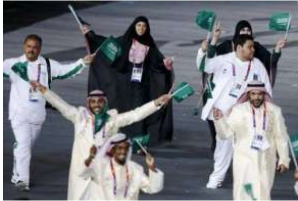
La delegación de Arabia Saudí en la ceremonia de apertura de los Juegos Olímpicos de Londres 2012. Es la primera vez que participan atletas femeninas de ese reino ultraconservador. Como se puede apreciar las mujeres desfilaron detrás de los hombres cumpliendo un estricto código de vestuario. (28/07/2012).