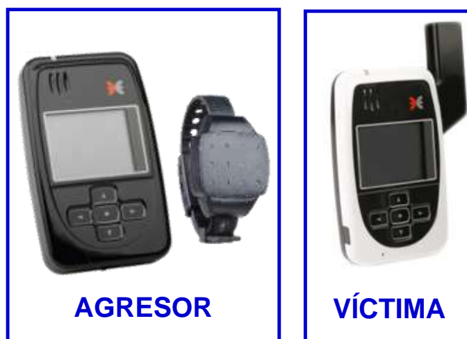
Ilustración 11: Dispositivos telemáticos