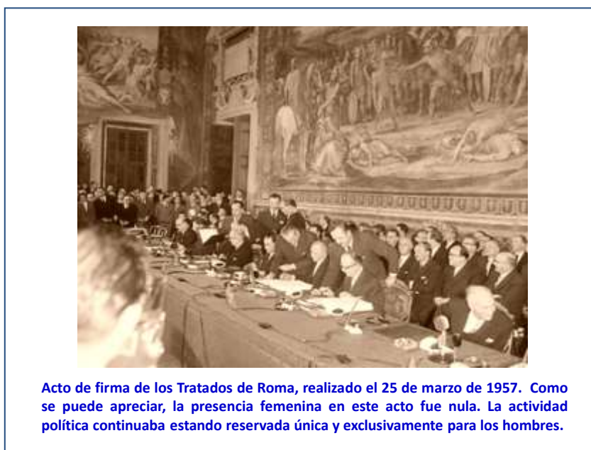
Ilustración 1: Firma Tratados de Roma

La Resolución 1162 (XII) de la Asamblea General de las Naciones Unidas, de 26 de noviembre de 1957 , sobre "Participación de la mujer en el desarrollo de la comunidad" 39 recomienda a los Estados Miembros que « estimulen por todos los medios a su alcance la plena participación de la mujer en el desarrollo de sus respectivas comunidades ».