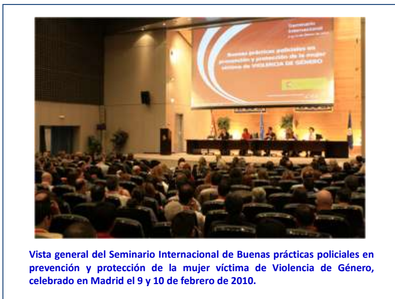
Ilustración 7: Seminario Internacional buenas prácticas policiales VdG

Paralelamente al Seminario se organiza un taller internacional que se encarga de elaborar un primer borrador del "Manual de Buenas Prácticas Policiales para combatir la violencia contra las mujeres" 184 de la Unión Europea.