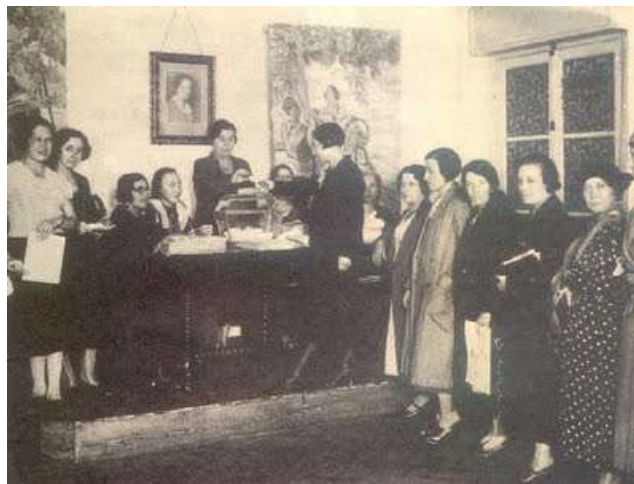
Mujeres votando por primera vez en 1933